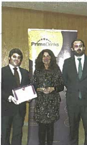
Restaurante premiado em concurso

A Carta de Vinhos Regional do Restaurante Terra Nostra recebeu uma menção honrosa, no concurso "Melhor Carta de Vinhos", que se realizou, no dia 11, em Lisboa, na Feira "Encontro com o Vinho e sabores".